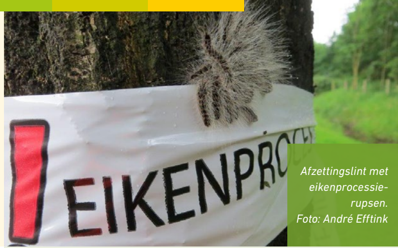
Afzettingslint met eikenprocessierupsen.